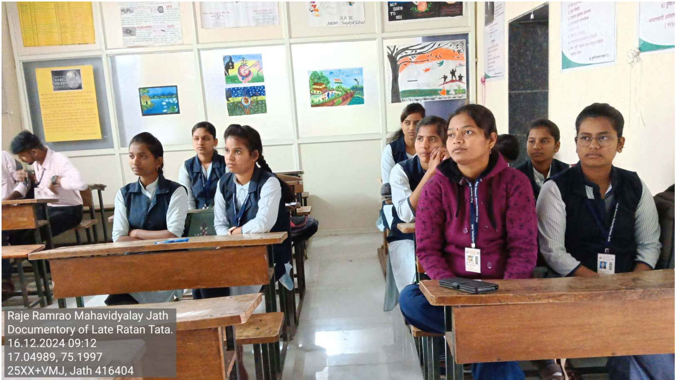
Raje Ramrao Mahavidyalay Jath Documentory of Late Ratan Tata. 16.12.2024 09:12 17.04989, 75.1997 25XX+VMJ, Jath 416404