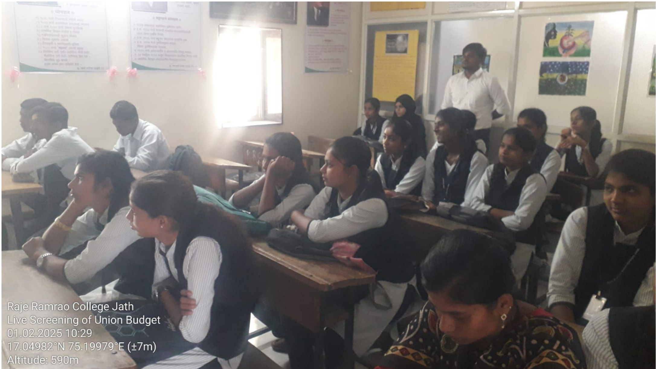
Raje Ramrao College Jath Live Screening of Union Budget 01.02.2025 10:29 17.04982°N 75.19979°E (±7m) Altitude: 590m