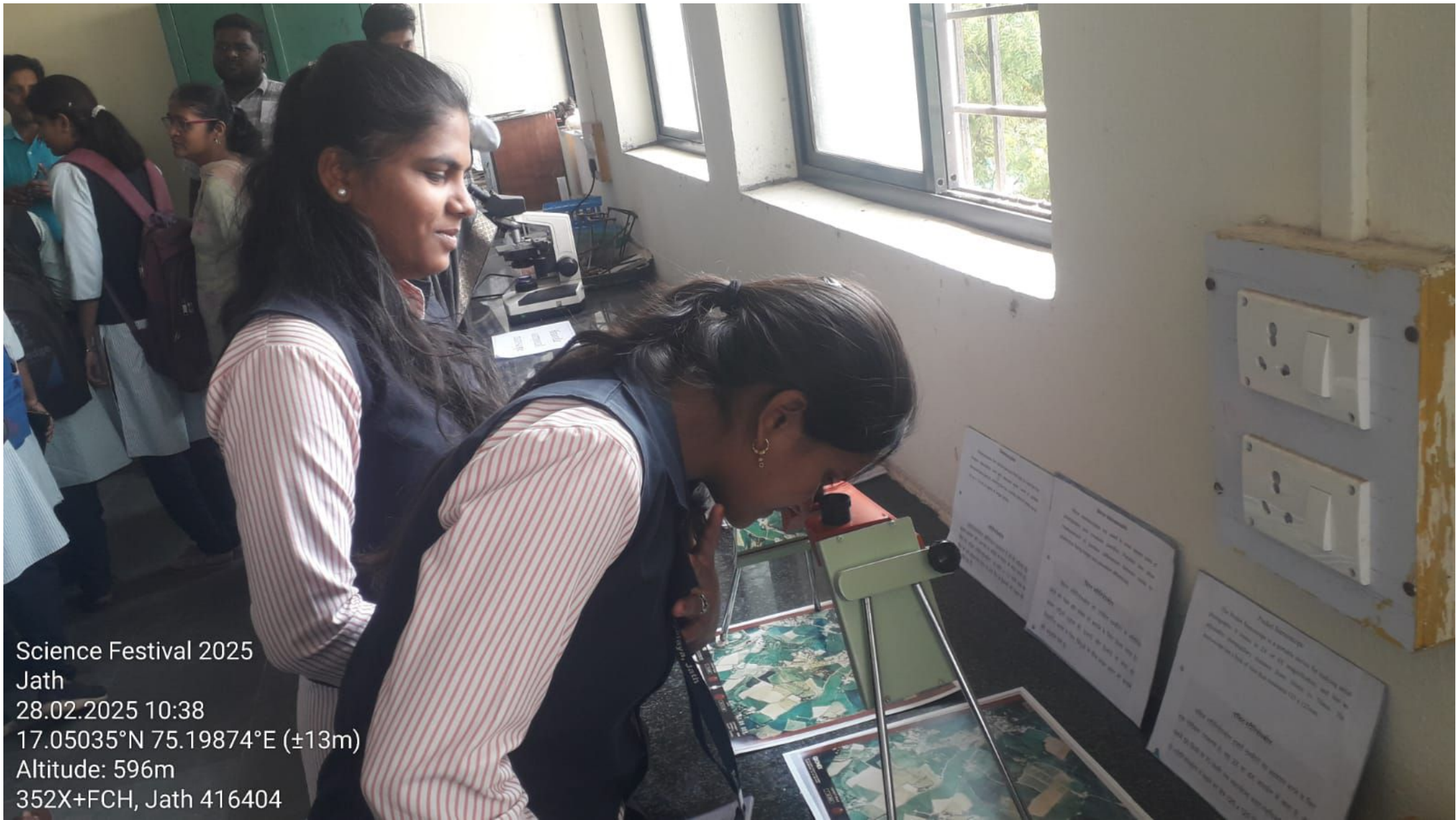
Science Festival 2025 Jath 28.02.2025 10:38 17.05035°N 75.19874°E ( \pm 13\text{m} ) Altitude: 596m 352X+FCH, Jath 416404