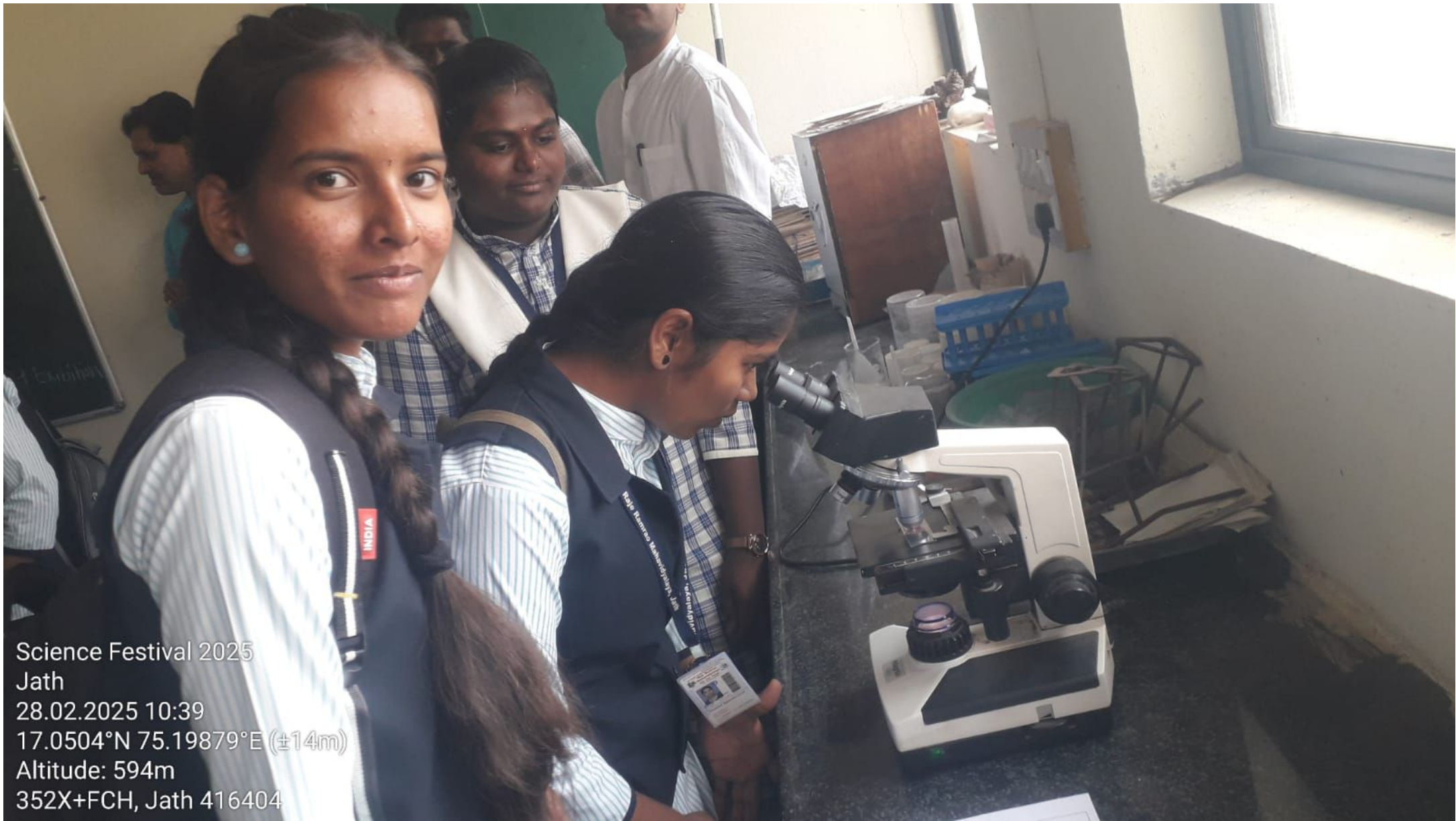
Science Festival 2025 Jath 28.02.2025 10:39 17.0504°N 75.19879°E ( \pm 14m ) Altitude: 594m 352X+FCH, Jath 416404