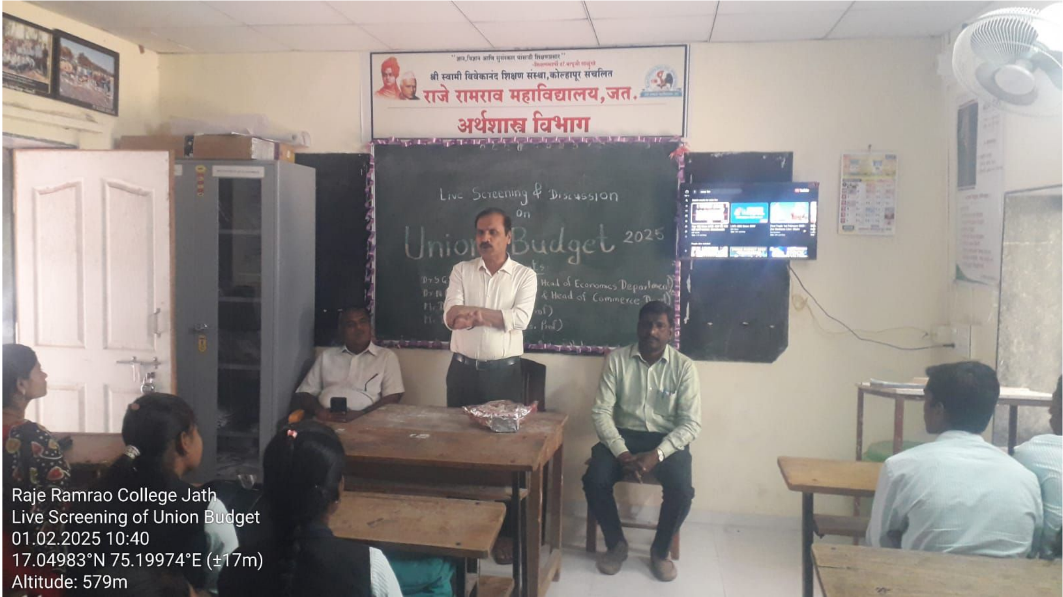
Raje Ramrao College Jath Live Screening of Union Budget 01.02.2025 10:40 17.04983°N 75.19974°E (±17m) Altitude: 579m