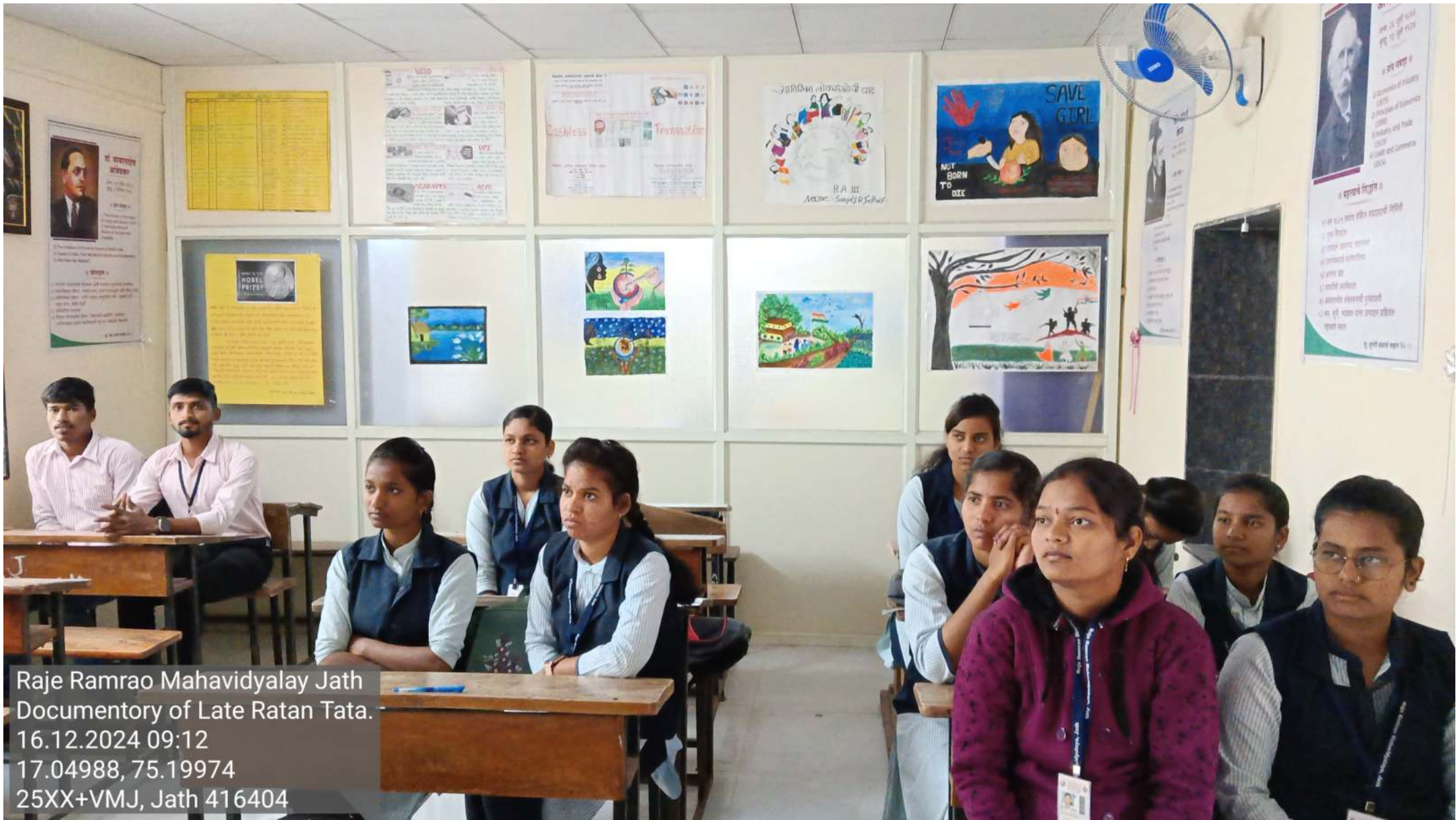
Raje Ramrao Mahavidyalay Jath Documentory of Late Ratan Tata. 16.12.2024 09:12 17.04988, 75.19974 25XX+VMJ, Jath 416404