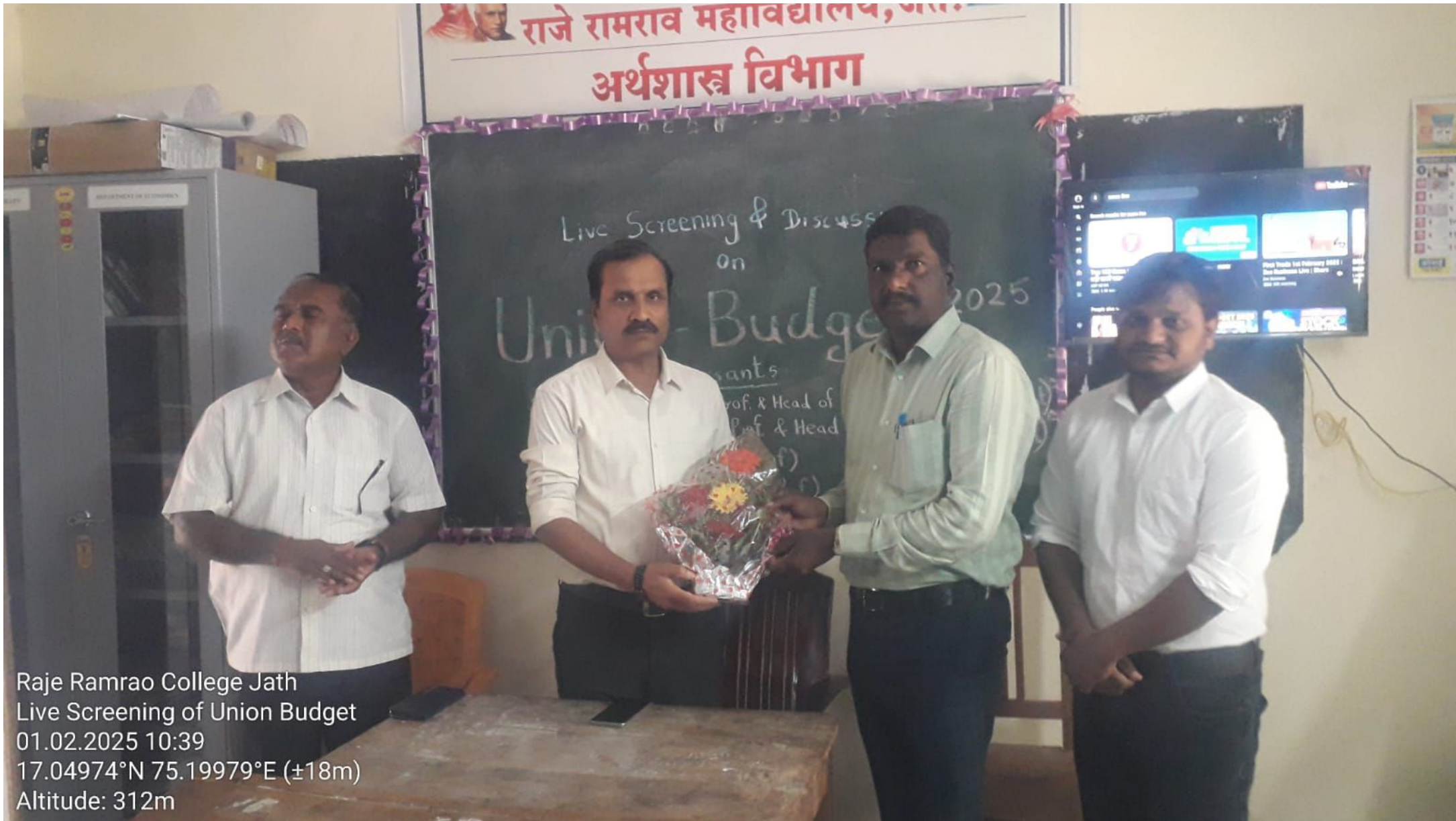
Raje Ramrao College Jath Live Screening of Union Budget 01.02.2025 10:39 17.04974°N 75.19979°E (±18m) Altitude: 312m