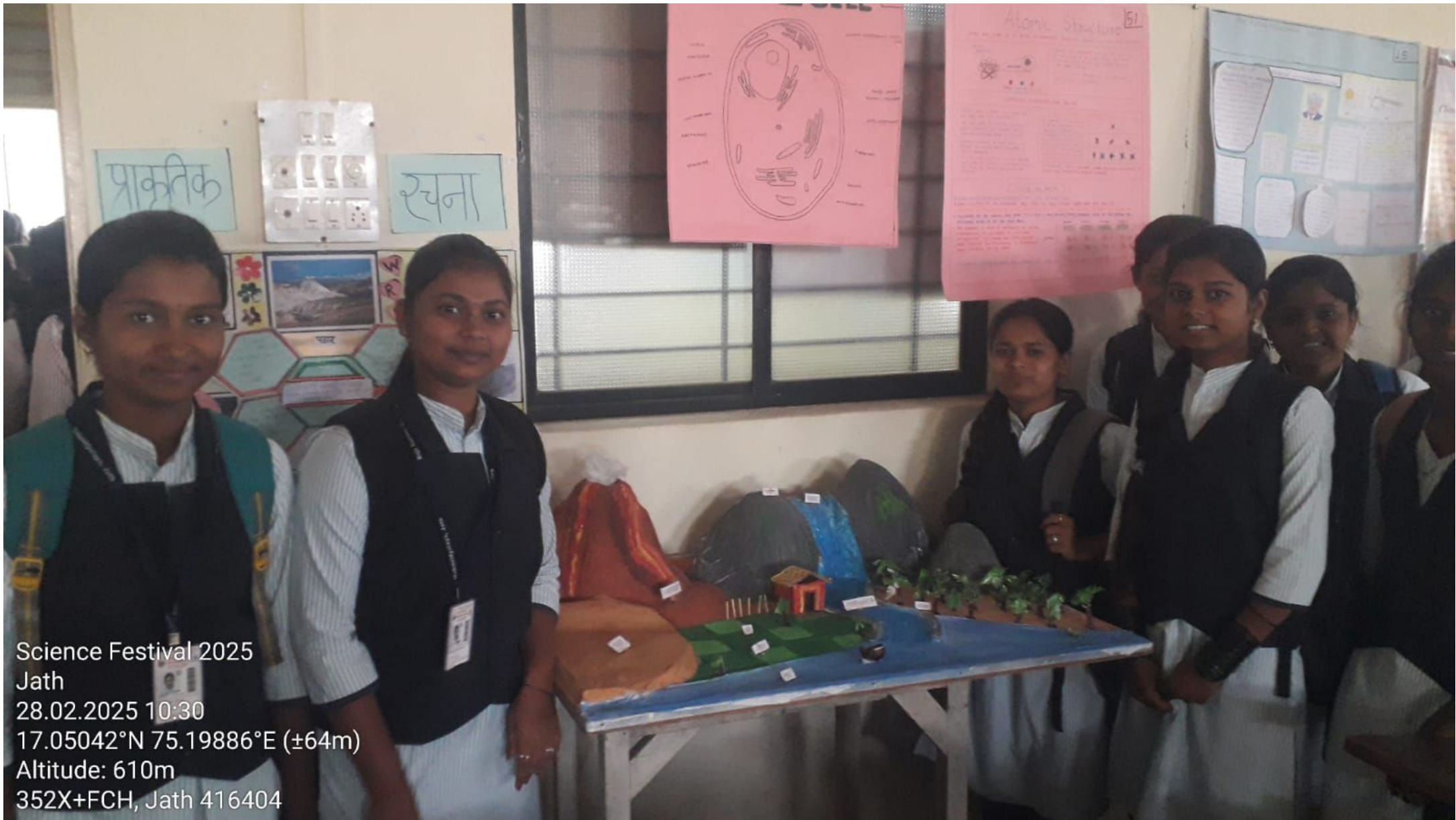
Science Festival 2025 Jath 28.02.2025 10:30 17.05042°N 75.19886°E ( \pm 64m ) Altitude: 610m 352X+FCH, Jath 416404