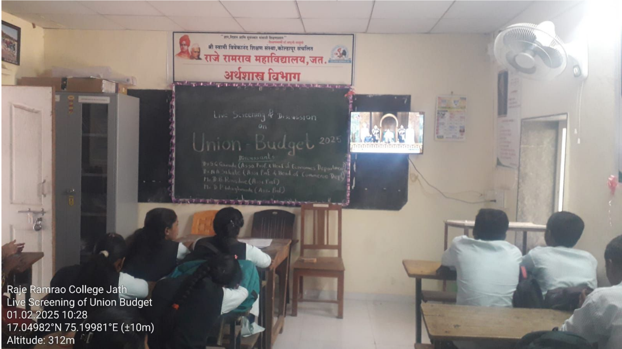
Raje Ramrao College Jath Live Screening of Union Budget 01.02.2025 10:28 17.04982°N 75.19981°E (±10m) Altitude: 312m