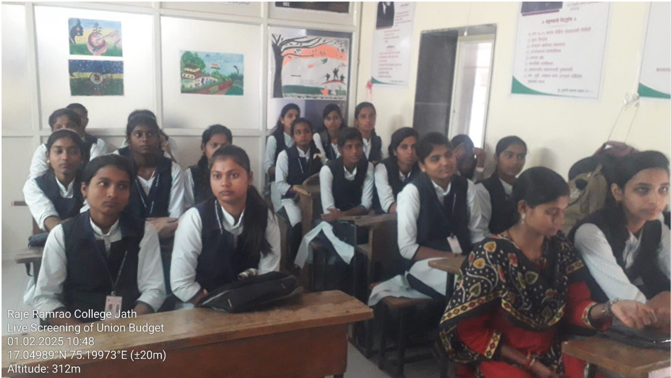
Raje Ramrao College Jath Live Screening of Union Budget 01.02.2025 10:48 17.04989°N 75.19973°E (±20m) Altitude: 312m